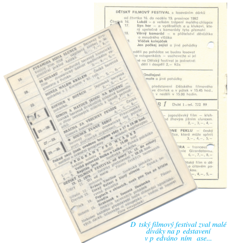
D ětský filmový festival zval malé diváky na p edstavení v p edváno ním ase...