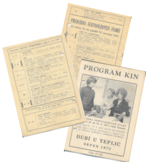
Film m v rámci FFP byla v nována i v programech kin zvláštní upoutávka...