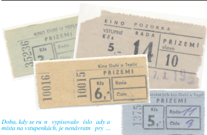
Doba, kdy se ru n vypisovalo íslo ady a místa na vstupenkách, je nenávratn pry ...

„pouhých“33 eských a slovenských film , v roce 1971 jich bylo 39, v roce 1972 41 a v roce 1973 produkce spadla na 33 premiér. Od po átku 80. let se již naplno projevila konkurence televize a našich filmových „trhák“, které by vyprodaly kina, za alo ubývat. áste n se toto ešilo obnoveními premiérami film zejména ze 60. let, mén pak z let 70., což bylo charakteristické pro druhou polovinu 80. let.