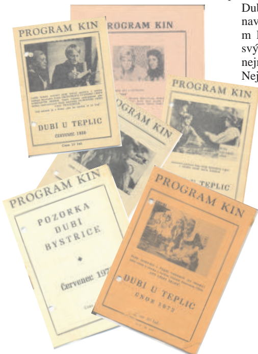
Program kin provázel diváky od roku 1970 do poloviny 90. let, kdy se poté program stal součástí Dubského zpravodaje. Kupovali jsme je za 20 haléřů ...

o vlivu na různé změny nařízením i vyhláškami kulturních odborů normalizačních institucí, kdy byla zařazována minimálně dvě představení filmů z produkce země bývalého Sovětského svazu a obvykle dvě představení kinematografií těch zemí, které jsme tehdy byli zvyklí tehdejším slovníkem označovat jako socialistické. (pokračování na str. 8)