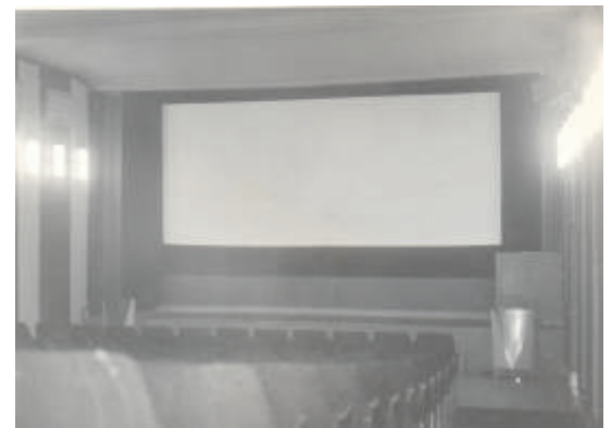
Hledišt kina v Pozorce