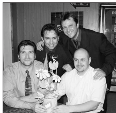
Šťastní majitelé vydraženého výrobku z dílny Arkádie přispěli postiženým sportovcům částkou 1250,- Kč.