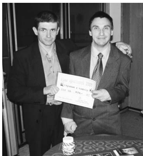
Výtěžek z tomboly 10 000,- Kč byl předán postiženým sportovcům