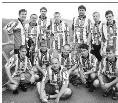
Na nejmodernějším skokanském můstku v Evropě

Prvním příjemným překvapením po příjezdu do místa finálové skupiny - Falkensteinu byl místní stadionek (kam autobus s hráči ochotně dovedl vůz německé policie) pro cca 2000 lidí, který byl velice slušně zaplněn nejen místními fanoušky fotbalu. Tím druhým překvapením bylo jméno a země původu semifinálového soupeře týmu z Dubí. Na "eskáčko" čekal vítěz skupiny B - turecký Inter Türkgücü. Zápas skončil v normálním hracím čase i přes herní převahu našich chlapců a dvou vyložených