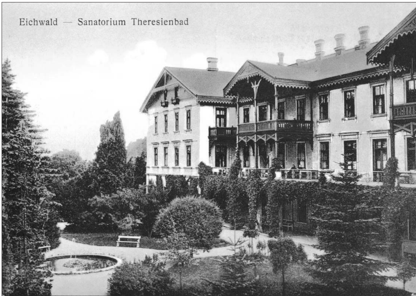
Tereziny lázně historické