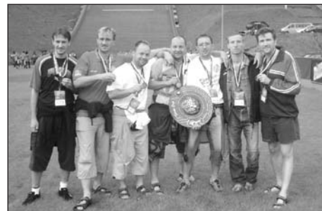
Pod Klingenthalským můstkem

A na závěr pár postřehů od těch, co se o úspěch na mezinárodním poli zasloužili a všem