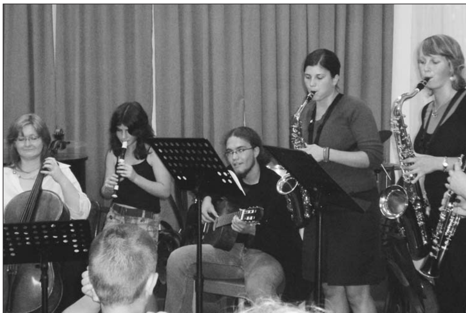
Studenti a pedagogové Muzikschule Arnstadt a ZUŠ Dubí při společné produkci (Kánon W. A. Mozarta "Bona nox")