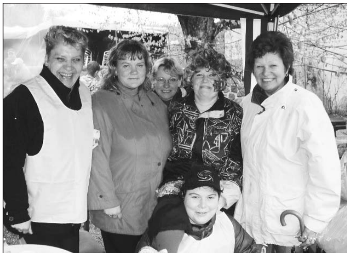
Část organizačního týmu