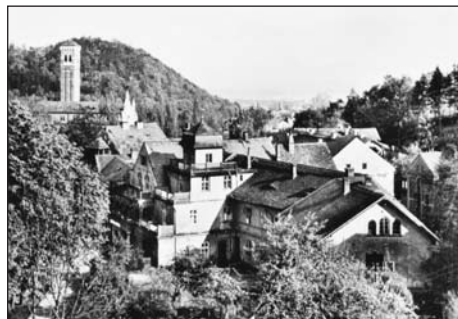
Horní Dubí podruhé