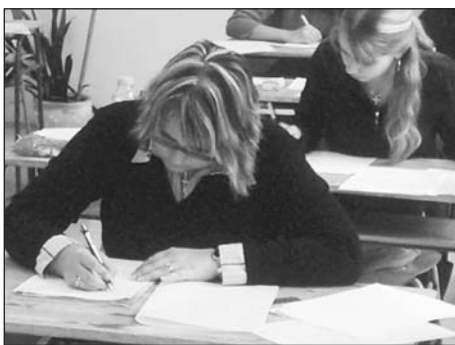
Studenti 4. ročníku denního studia při řešení případových studií.

V pondělí 23. května 2005 byly ve Střední škole sociální PERSPEKTIVA a Vyšší odborné škole s. r. o. zahájeny maturitní zkoušky. Studenti oboru Sociální péče se zaměřením na sociálněsprávní činnost skládají odbornou část maturity z předmětů Právo a Sociální politika. Praktická část obsahuje několik případových studií, jejichž vyřešení předpokládá znalosti v oblasti státní sociální podpory, nemocenského pojištění, sociální péče, péstounské péče, sociálních příplatků, rodičovských příspěvků apod. Nabyté vědomosti budou studenti využívat nejen ve své profesi, ale určitě pomohou odbornou radou svým blízkým či známým.