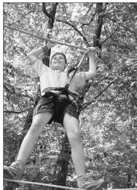
Na některých akcích dubských pionýrů jsou oblíbené i lanové aktivity