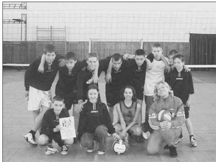
"Stříbrný" bystřický celek