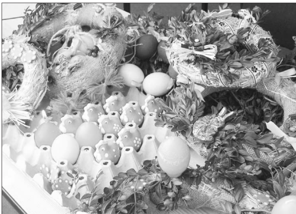
Pohodové velikonoční svátky přeje Městský úřad Dubí.