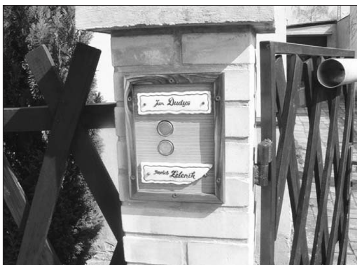
V den oslav byla branka u Zeleníků stále dokořán!