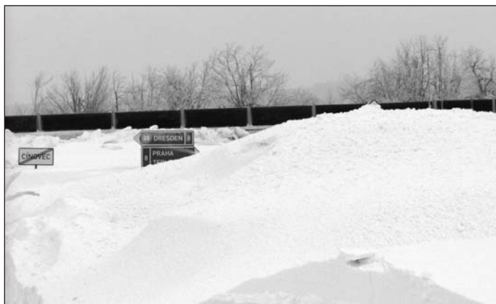
Letošní zima sněhem nešetřila. Na Cínovci to mnohdy vypadalo jak za polárním kruhem.