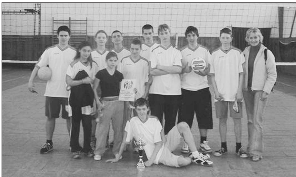
Novosedlice stejně jako loni nezaváhaly.