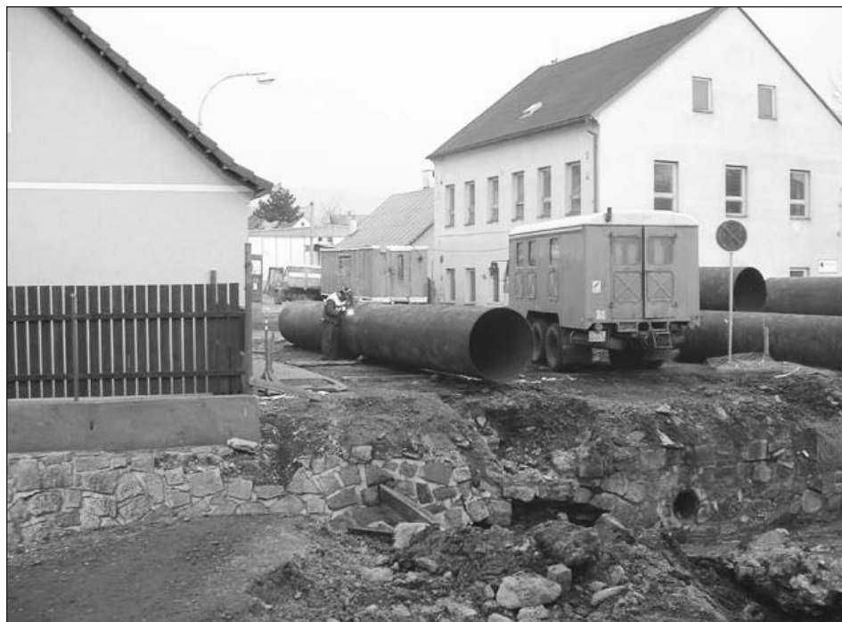
Práce na přemostění potoka Bystřice v Dlouhé ulici jsou v plném proudu.