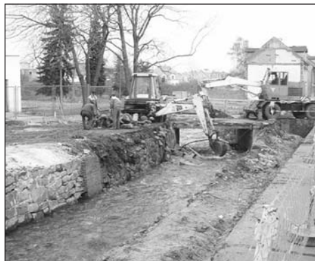
Po celý měsíc únor probíhaly práce na stavbě nového mostu v Bystřici. Netrpělivě na jeho dokončení čekají především motoristé a obyvatelé ulic Dlouhá a Tovární.