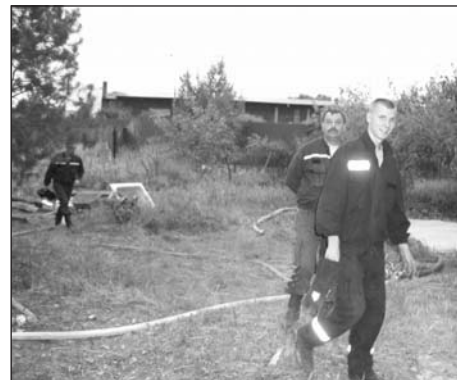
Dubští hasiči po zásahu při požáru - ilustrační foto (bob)

Během prvních dvou měsíců letošního roku se dubští hasiči rozhodně nenudili. Dvakrát přijeli vyčerpávat vodu ze zatopené sklepa rodinného domu ve Mstišově. Podíleli se rovněž na vyproštění zapadlého nákladního automobilu v Dubí u lázní. Děšť spolu s táním sněhu zaměstnal hasiče při vyčištění koryta potoka Bystřice od naplavenin. Nad Českým porcelánem mnoho nechybělo a voda se vylila na komunikaci. Přes mráz a sníh došlo i na požáry. Za školou v Dubí hořela hromada kletí, na Cínovci bylo zapotřebí uhasit požár osobního automobilu.