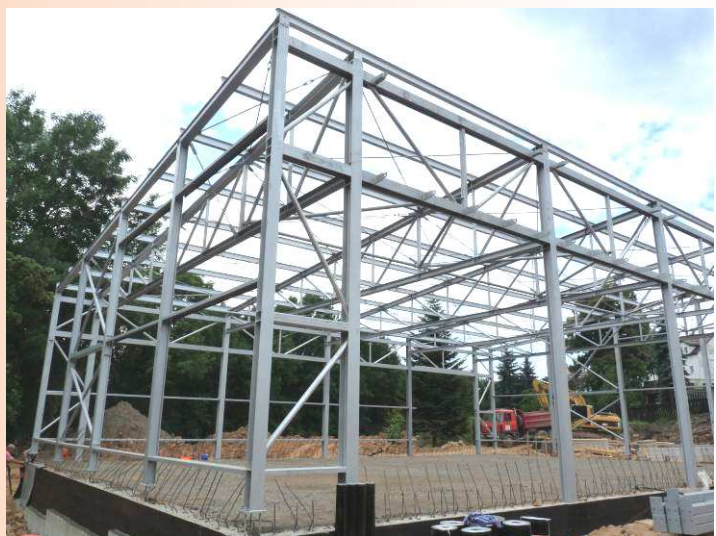
Foto: Konstrukce nové zbrojnice

Na nezastavěném území ve středové části města Dubí vznikne projekt „Hasičská zbrojnice – centrum prevence, ochrany, komunitního a volnočasového života v Dubí“. Budova a areál bude sloužit jako zázemí pro volnočasovou a komunitní činnost. Tento areál umožní rozšířit možnost zájmových činností občanů města Dubí zejména v technických oborech. Účelem projektu je zvýšit kvalitu života ve městě Dubí a rozšířit tak možnosti realizace občanů ve veřejně prospěšné činnosti i v oblasti komunitního setkávání. Zbrojnice samozřejmě bude také zázemím protipožární jednotky, která zajišťuje bezpečí občanů města Dubí.